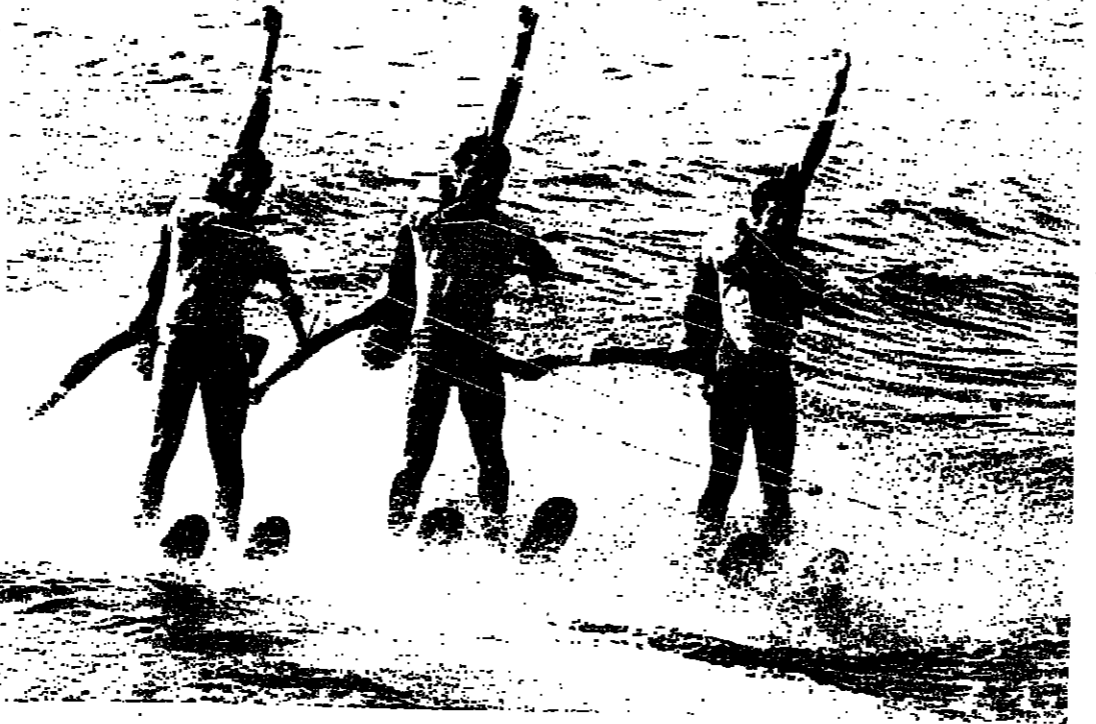
مشهد من الاستعراضات وتبدو الفتيات في وضع منحرف رأسا على عقب